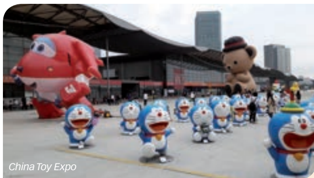
China Toy Expo