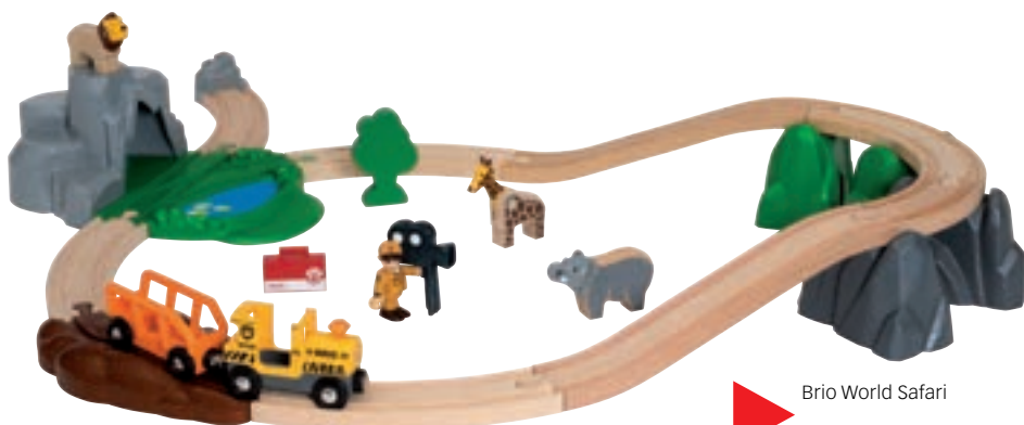
Brio World Safari

BRIO Builder is het ideale speelgoed voor creatieve kinderen met een rijke fantasie. Het is een constructiesysteem op groot formaat dat zowel componenten van hout