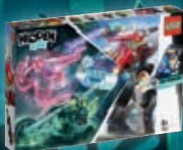
70421 Le quad chasseur de fantômes