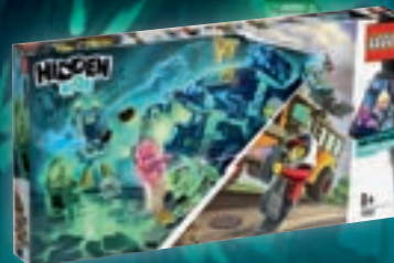
70423 Le bus scolaire paranormal