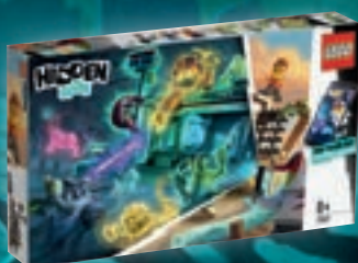
70422 Le restaurant hanté