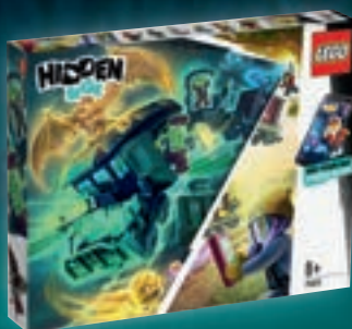
70424 Le train-fantôme