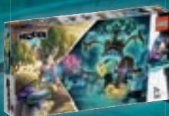
70420 Le cimetière mystérieux