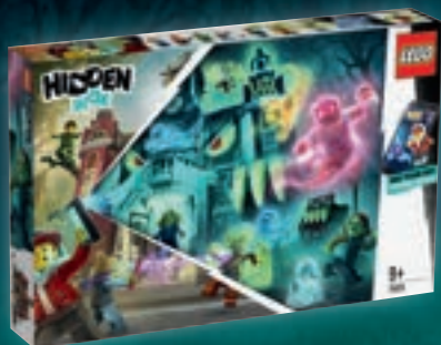
70425 L'école hantée de Newbury

LEGO Hidden Side bénéficiera dès son lancement d'un soutien en ligne et hors ligne.