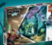
70418 Le laboratoire détecteur de fantômes