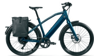
Strömer ST1 Special Edition