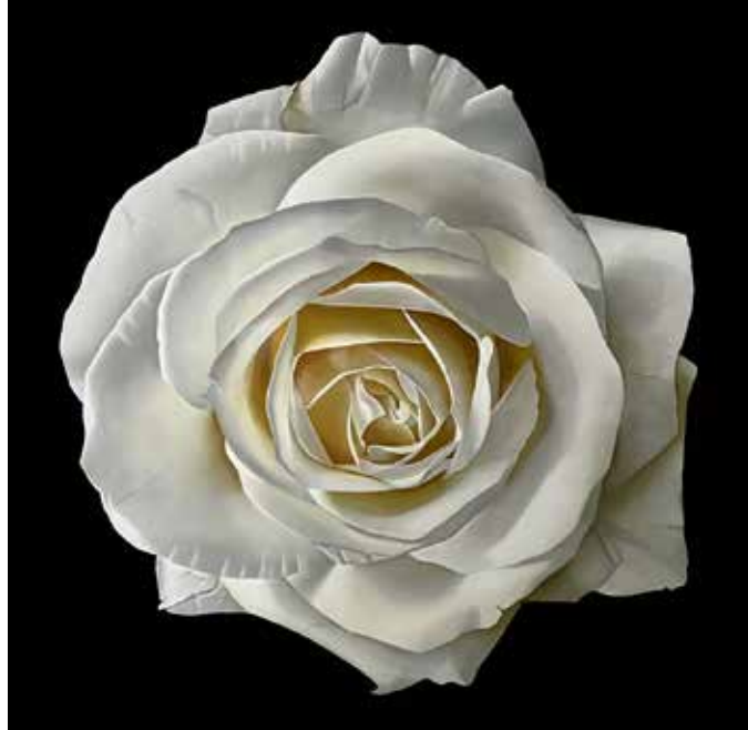
White rose | Jeroen Paulussen | huile sur panneau