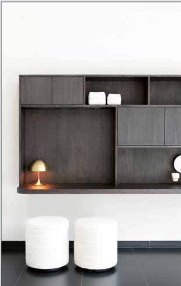
Le Home Office avec bureau mural Gobi, 100% sur mesure pour votre intérieur, est fonctionnel et attire l'attention.