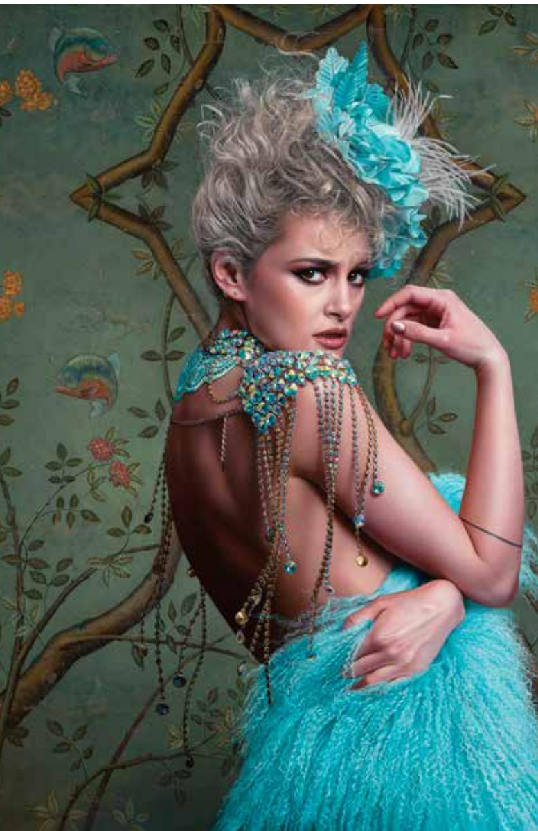
Bite me | IBEX Masters - Marco Grassi | huile sur toile