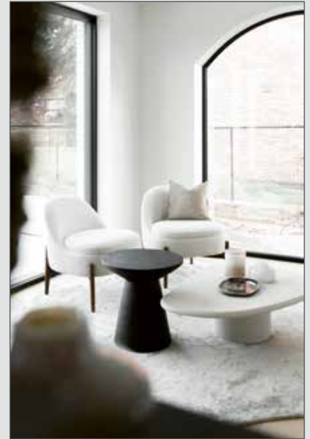
Cette petite maison a été modernisée avec des sièges IOS et des chaises Rico.