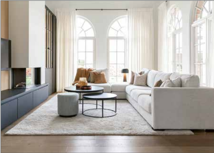
Avec des couleurs douces et des touches de bois chaudes, rêvez dans ce joyau d'intérieur.