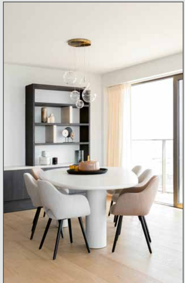
Les tons chauds et estivaux, ainsi que l'éclairage d'Atmooz, créent une atmosphère de vacances détendue dans cet appartement.