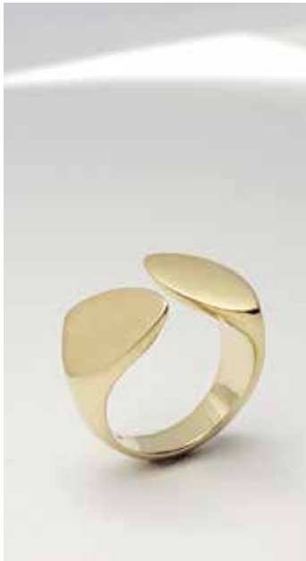
TEKST: INGRID SNEIDERS