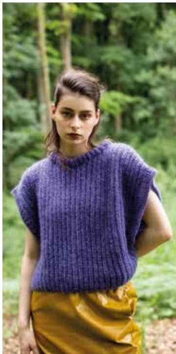
TEKST: MADE BY VEST